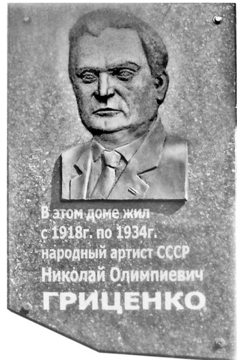
Рис. 4 – Меморіальна дошка на будинку, в якому жила родина Гриценків (м. Ясинувата Донецької обл., вул. Октябрська, будинок № 137)

Микола Гриценко, а потім і його сестра, навчався у школі № 1. Крім того, хлопець навчався гри на скрипці у місцевому музичному училищі, за підтримки