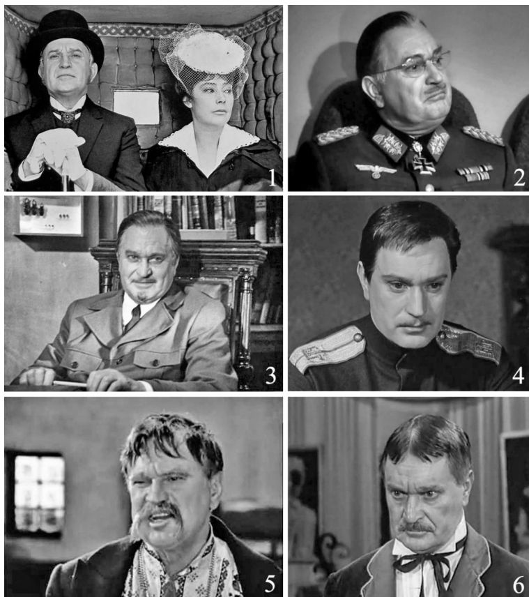
Рис. 1 – Микола Олімпійович Гриценко в кіноролях: 1 – Олексій Олександрович Каренін, «Анна Кареніна» (1967); 2 – німецький генерал у поїзді, «Сімнадцять митей весни» (1973); 3 – Микола Антонович Татаринів, «Два капітани» (1976); 4 – Вадим Петрович Рошин, «Ходіння по муках» (1959); 5 – старшина Василь Миронович, «Веселі Жабокричі» (1971); 6 – Вікентій Павлович Сперанський, «Ад'ютант його вельможності» (1969)

Миколі Гриценку присвячено серію нарисів у періодичних і тематичних виданнях про театр і кіно, його персоналії можна знайти у багатьох довідково-енциклопедичних виданнях різних країн. До 100-річчя актора побачили світ дві книги, одна з яких написана колегами по Вахтангівському театру [1], а друга підготовлена музейними співробітниками з його малої батьківщини [16]. Під час краєзнавчих розвідок нашу увагу в цьому масиві публікацій привернула та обставина, що деяка інформація з них, зокрема біографічного характеру, не відповідає історичній істині або є неточною. Саме це спонукувало автора підготу-